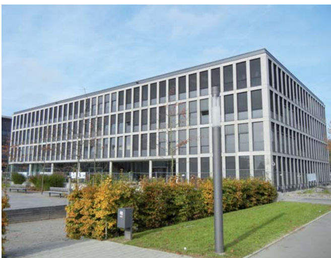
Bürogebäude Ferchau, Gesamtansicht

Die Maschinenbauindustrie benötigt Maschinenbetten mit einer definierten