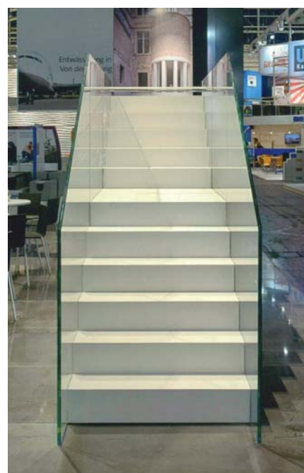
Treppe München, Frontalansicht