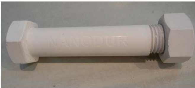
Betonschraube als Bestandteil eines Betonkanus