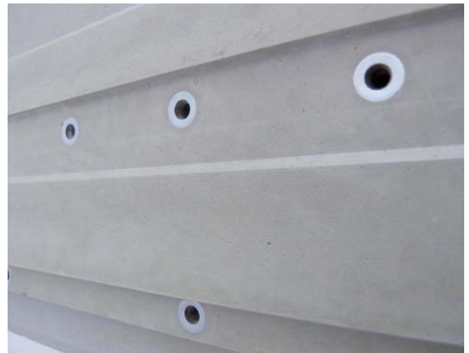
Hochpräzise Oberfläche im Betonwerk der Sudholt-Wasemann GmbH

Bei der Prüfung der Oberflächenzugfestigkeit mit Ringnut konnten Werte von ca. 4,2 N/mm 2 nachgewiesen werden, wobei der Abriss immer im Beton und nie in der Kontaktfläche zwischen Kleber und Beton stattfand.