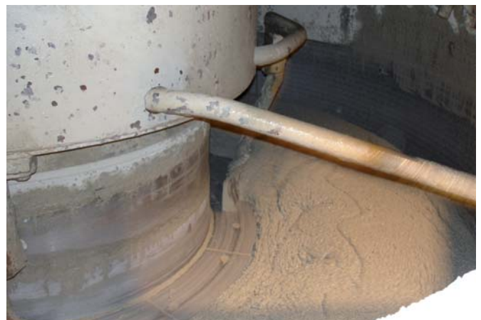
Mischen von Nanodur-Beton