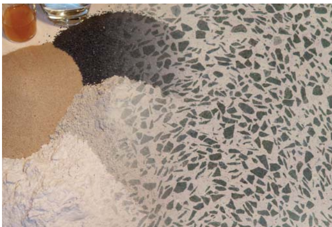
Ausgangsstoffe der Mischung

Unbewehrte, faserfreie, nicht thermisch nachbehandelte Nanodur-Betone weisen bei der Normprüfung an Mörtelprismen je nach Rezeptur eine Biegezugfestigkeit von 15-25 N/mm 2 auf. Damit verbleibt dieser Beton sehr lange im ungerissenen Zustand. Er kann somit wirtschaftlich in Anwendungen eingesetzt werden, bei denen eine Rissbildung nicht erlaubt ist und die Zugfestigkeit des Materials das maßgebende Kriterium darstellt. Bei diesen Anwendungen kann man auf Bewehrung und Fasern verzichten, was deutliche Kostenvorteile birgt. Beim Einsatz von Schwindreduzierern beträgt das Schwindmaß ca. 0,5 bis 0,6 mm/m und entspricht etwa demjenigen von Normalbeton.