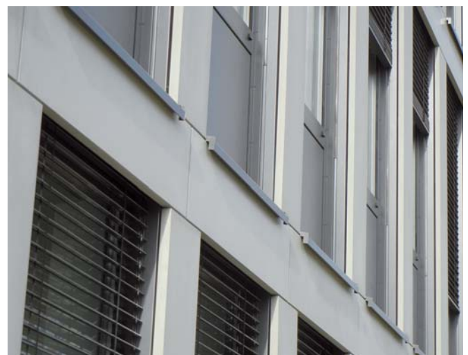
Bürogebäude Ferchau, Fugenausbildung