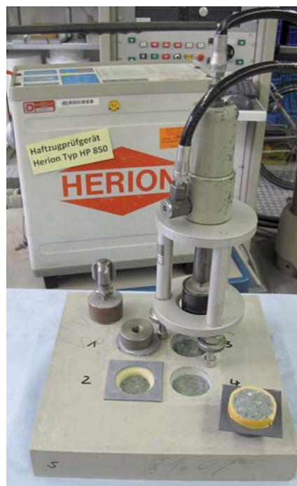
Prüfung der Oberflächenzugfestigkeit

Werkstoffes, der mittels unterschiedlicher Rezepturvarianten an viele Herausforderungen angepasst werden kann. Die Dyckerhoff AG, hat das Spezialbindemittel Nanodur Compound 5941 für UHPC entwickelt und unterstützt Forschung, Entwicklung und Vertrieb zu Bauteilen, Maschinenbetten und anderen Anwendungen aus Nanodur-Beton.