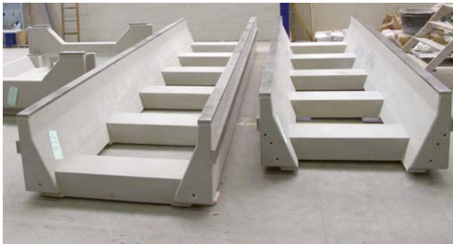
Betonkörper eines Maschinenbettes