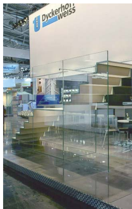
Treppe München, Seitenansicht