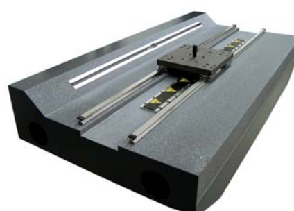
Messgeräteunterbau aus InnoCrete